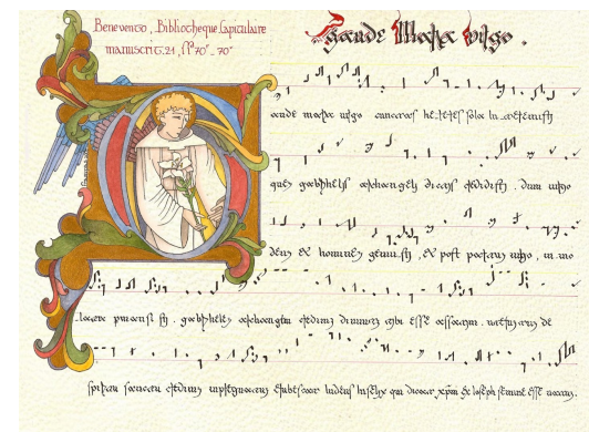
Enluminure : Véronique FRAMPAS