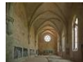
l'abbaye de Silvacane à La Roque d'Anthéron