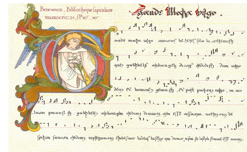
Enluminure : Véronique FRAMPAS