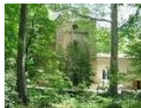
l'abbaye de Saint Pons à Gémenos