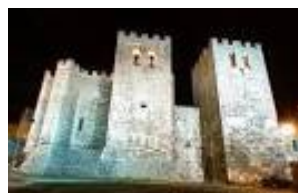
l'abbaye de Saint-Victor à Marseille

Lieu des essais acoustiques : l'abbaye de Saint Pons à Gémenos, l'abbaye Saint-Victor à Marseille et l'abbaye de Silvacane à La Roque d'Anthéron . (covoiturage)