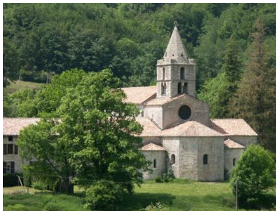
Abbaye cistercienne de Léoncel en Drôme