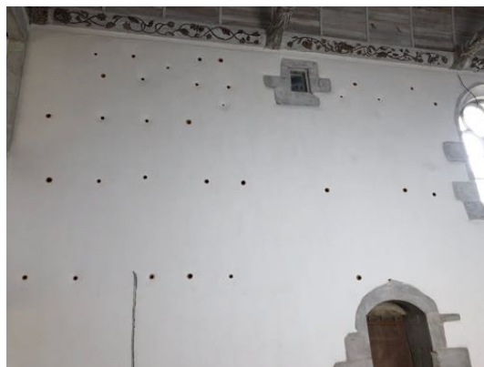
Abbaye Notre-Dame-des-Anges, Landéda (L'Aber Wrac'h)