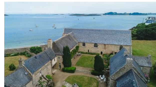
Abbaye Notre-Dame des Angés (Landéda)